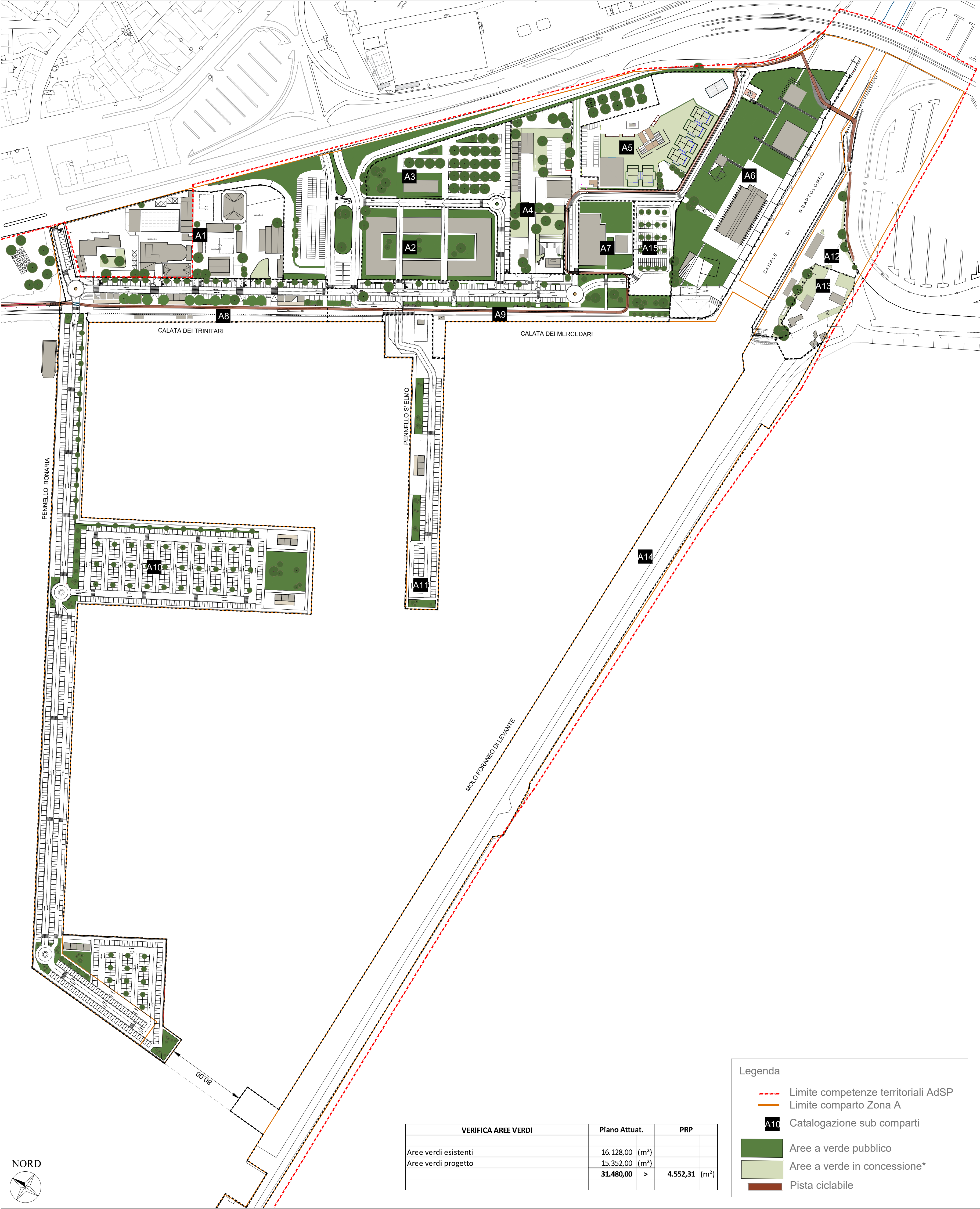
Planimetria Stato di Attuazione degli interventi scala 1:2.000